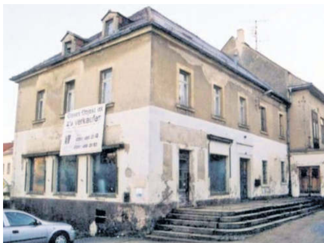
Diesen Zustand des Hauses kennen noch viele.

des Hauses näher. Gestartet wurde damit in der Ausgabe des Monats August 2019. Damals schrieb er unter anderem: „Ich