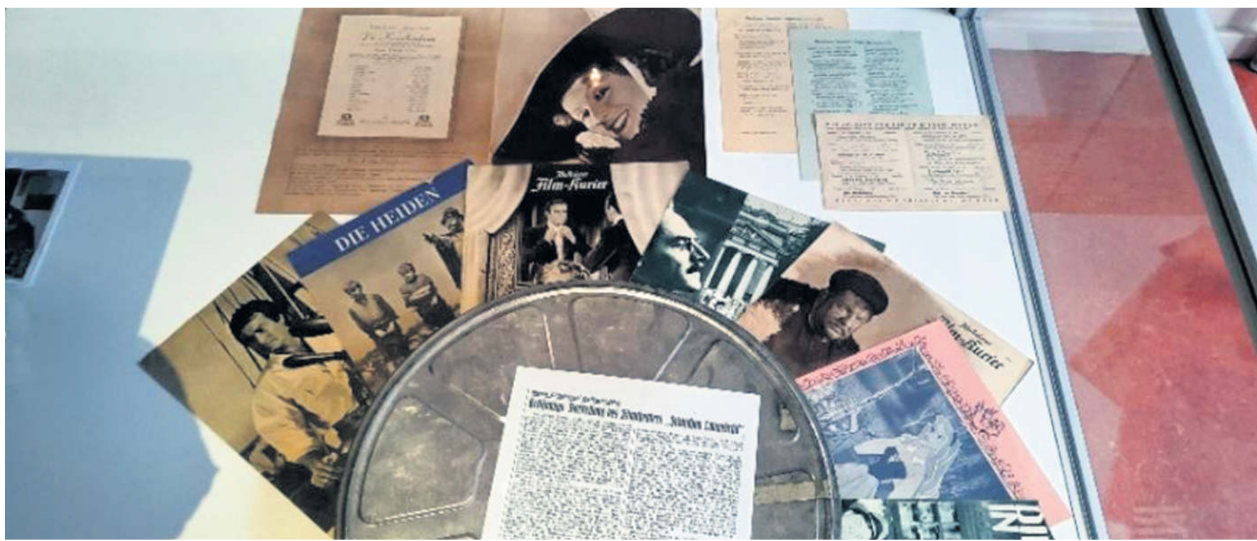
Anlässlich zehn Jahre Bürgerhaus in seiner heutigen Form hat die Ortschronik auch viele historische Bilder zusammen getragen.