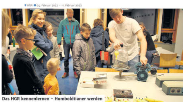
Das HGR kennenlernen - Humboldtianer werden