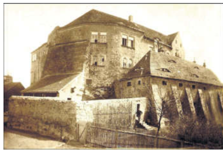
Burg und Schloss Radeberg - Zufluchtsort für einige sächsische Landesherren und ihr Gefolge. Quelle: Archiv Museum Schloss Klippenstein Radeberg, Foto um 1900