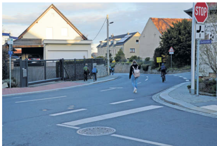
Am Knotenpunkt Dr.-Rudolf-Friedrichs-Straße / Karlstraße / Lotzdorfer Straße / Sonnenweg sind in den frühen Morgenstunden eher die Schüler der Ludwig Richter Oberschule zu beobachten. Die unübersichtliche Kreuzung stellte sich als allgemeine Gefahrenstelle heraus.

Verkehrsschwerpunkte im Fokus - Kreuzungsbereich Dr.-Rudolf-Friedrichs-Straße / Karlstraße / Lotzdorfer Straße / Sonnenweg