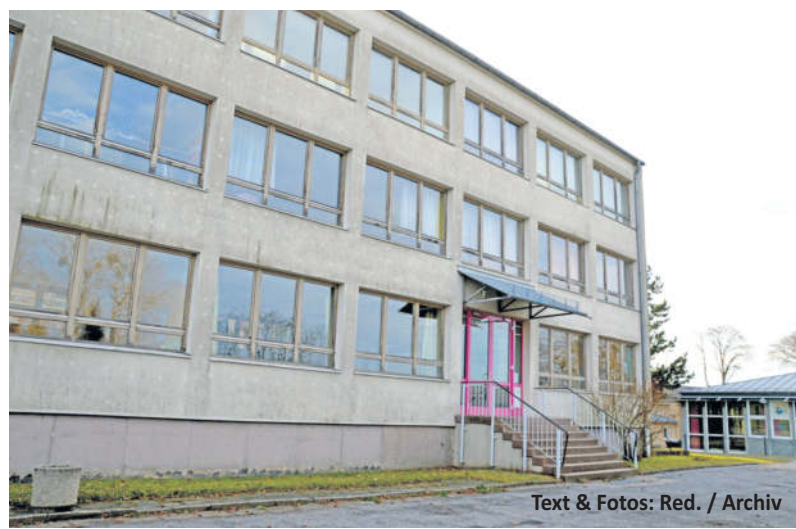
Text &amp; Fotos: Red. / Archiv

Noch gehört sie zum Ortsbild von Arnsdorf - die alte Plattenbauschule an der Stolpener Straße. Von außen ist nichts von den großen Plänen rund um den Neubau einer Oberschule zu sehen und auch die Abrissbagger scheinen noch weit entfernt.