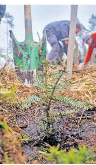
Anfang April war das GreenTeam des Humboldt-Gymnasiums zur Baumpflanzaktion der Schule in der Dresdner Heide dabei.

Beispiel an der Begrünung des Schulgeländes oder der Verbesserung der Mülltrennung. Wir wollen prüfen und versuchen für ein verantwortungsvolleres Wegverhalten zu sensibilisieren. Das Schöne ist: Nachdem wir Klimaschule sind, werden viele neue und interessante Aktionen möglich.