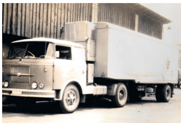
Ein modernes Fahrzeug von damals, der Skoda 706 RT Kühlzug

Unsere Fahrzeuge hatten im Sommer zu Erntezeiten oft noch andere Aufgaben zu bewältigen. Das soll zum Schluss dieses Berichtes noch angehängt werden. Die ersten LPGs wurden in diesen Zeiten mit unseren Fahrzeugen bei der Erntebearbeitung tatkräftig unterstützt. Wir fuhren mit den Fahrzeugen auf das Feld, das Fahrzeug wurde mit Gabeln von Hand beladen und wenn's voll war zum Druschplatz oder in die Scheune zum Einlagern gefahren. Am nächsten Tag konnte man, wenn man Glück hatte, das ausgedroschene Getreide in Säcken oder auch lose in die Lager nach Dresden oder Kamenz fahren. Hatte man das Pech das lose Getreide zu transportieren, musste man erst einmal aufwendig die Ladefläche mit Planen dichtmachen, damit während der Fahrt nicht so viel durch die Ritzen verloren ging. Dafür gab es von den beteiligten Bauern reichliche Mahlzeiten zum Vertreiben des Hungers wofür einige Schweine dran glauben mussten.