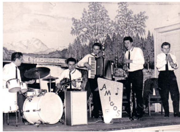
Die Kapelle des Kraftverkehrs Radeberg

Wo gearbeitet wird, wird auch gefeiert. Mit eben diesem Gedanken dauerte es auch nicht lange, da fanden sich 5 Kollegen zusammen, die ein Instrument spielen konnten und eine Kapelle unter dem Namen KV Kraftverkehr gründeten, und die den betrieblichen Festlichkeiten zur Verfügung stand. Zuerst als „KV“ gegründet, später als „Amigos“ in den umliegenden Ortschaften zum Tanz aufspielend, machten sich die Jungs auch in der Bevölkerung nützlich.