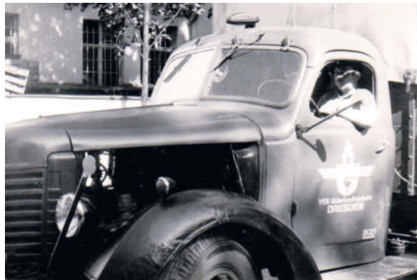
Fahrt im Nahverkehr, bei Kundschaft

Eine andere Begebenheit, noch mit meinem SIS, ist wohl noch erwähnenswert. In einem schönen Wintertag war mein Auftrag, eine Ladung frisch gebrannter Ziegelsteine von einer Ziegelei in Radeburg nach Cottbus zu fahren. Bei schönstem Winterwetter war mein Lkw schnell beladen. Und weil die nötige Winterausrüstung, wie Schneeketten, Ersatzrad und zwei Schaufeln, die „für alle Fälle“ mitgeführt werden mussten, keine Halterung hatten, lag diese Ausrüstung auf den Ziegeln. Das Ersatzrad lag noch nicht an der richtigen Stelle und als ich es aufrichten und umlagern wollte, kippte es mir aus den Händen und fiel auf eine der Schaufeln. Der Stiel schnellte nach oben und mir direkt an den Kopf. Das bescherte mir eine Gehirnerschütterung, und 4 Wochen Krankschreibung. Man höre und staune: schon nach 3 Tagen waren Halterungen für diese Gerätschaften am Fahrzeug angebracht, was vorher nicht möglich war.