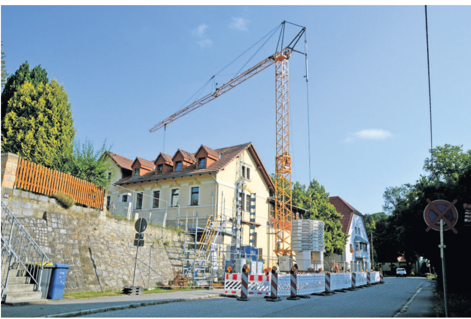
Die Baukosten steigen auch beim Projekt „Umbau und Sanierung des Gebäudes Silberdiele“. Für die Elektrotechnik muss die Stadt Radeberg nun tiefer in die Stadtkasse greifen.

In der Silberdiele Liegau-Augustusbad soll eine Begegnungsstätte für Jung und Alt entstehen, in der das Ordnungsamt, der Schulhort, ein Jugendclub und Begegnungsräume entstehen.