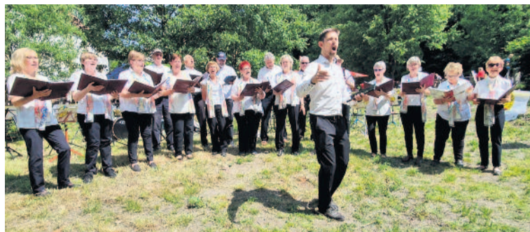
So kennen die Langebrücker ihren Nicodéchor. Das wird auch so bleiben, es wird ein zusätzliches, spannendes Projekt geben.

Traditionsreich ist der Langebrücker Nicodéchor. Immerhin besteht er seit mittlerweile 77 Jahren. Doch die Verantwortlichen wollen ein weiteres Projekt starten. Heißt, der Chor bleibt bestehen, doch sie planen ein zusätzliches Projekt. „Wir, der Nicodéchor Langebrück, möchten uns gern erweitern und noch in eine andere musikalische Richtung gehen“, heißt es dazu. Sie versprechen sich