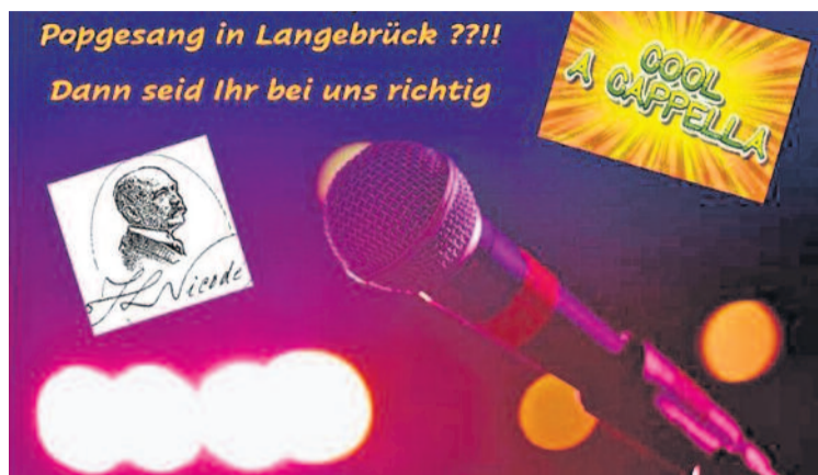
Mit dieser Ankündigung verraten die Verantwortlichen ein klein wenig, wohin die Reise gehen soll.

Wer mehr über das Projekt erfahren oder, noch besser, dabei sein will, kann sich schon einmal den Termin im Kalender