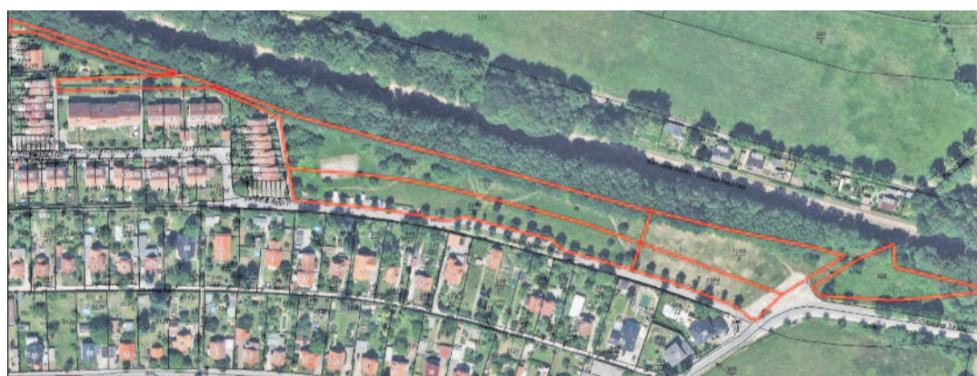
Um diese rot markierten Flächen an der Neulußheimer Straße geht es.

ses wahrzunehmen, zudem stellte der Ortschaftsrat eine Mitfinanzierung in Aussicht. In der jüngsten Junisitzung war es wieder Thema, hier wurde bekannt, dass die Langebrücker maximal 30.000 Euro dafür geben werden. Diese fünf unbebauten Grundstücke an der Neulußheimer Straße werden nur zusammen veräußert.