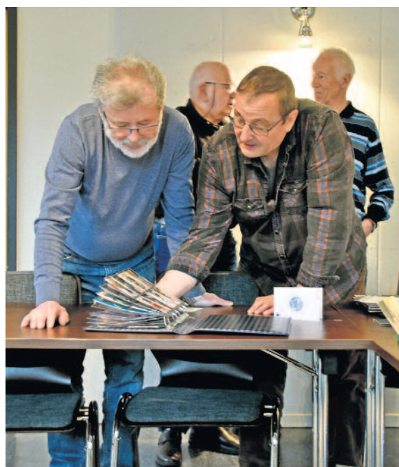
Neben einem Vortrag steht der rege Austausch unter Sammlerfreunden im Vordergrund.