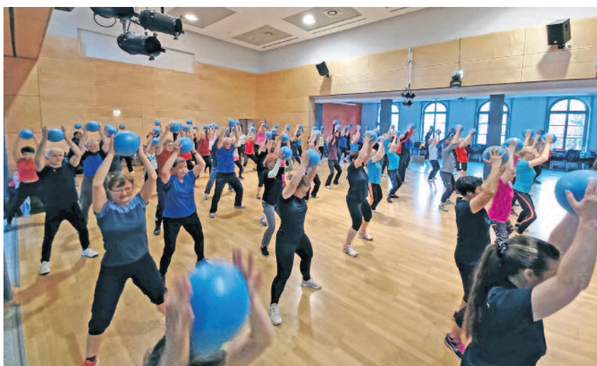
Groß war erneut das Interesse an diesem Sportabend im Bürgerhaus.

Übrigens geht es weiter, denn die Planungen für den dann 6. GYMWELT-Abend in Langebrück im Frühjahr 2024 laufen bereits.