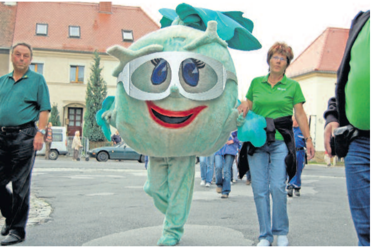
2009 hatte sich das Kohlrabi-Inselfest bereits im Radeberger Veranstaltungskalender zu einer festen Größe entwickelt und etabliert.

Mit einem kräftigen „KOHLRABI - ZZZIIIEEEEEHHHHH!!!“ Der Kohlrabi-Inselverein Radeberg e.V.