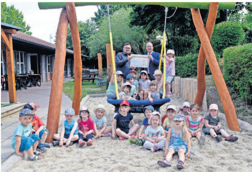
Die Hummelgruppe der Kita Leppersdorf bedankt sich bei einem der Unterstützer, dass ihnen die schöne neue Nestschaukel im Außenbereich viel Freude bereitet.

Neben der Finanzierung durch die Gemeinde beteiligten sich auch Leppersdorfer Unternehmen, wie Helestra oder Müllermilch an den Kosten für das Spielgerät. Auch die Manfred Roth Stiftung