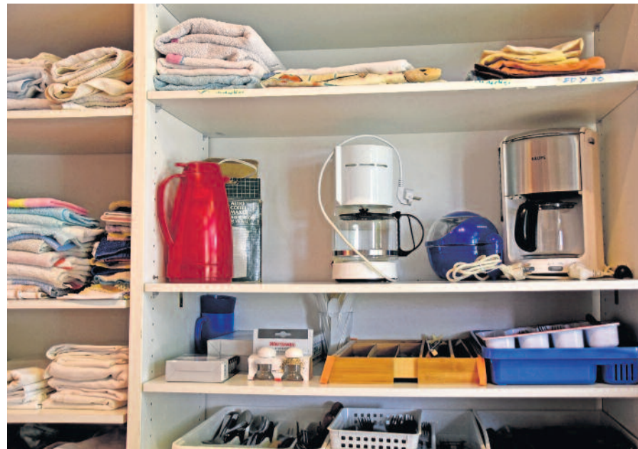
Kleinere Küchen- bzw. Elektrogeräte, wie etwa Wasserkocher, werden momentan in der Kleiderkammer benötigt. Wer Spenden abzugeben hat, kann dies gern zu den Öffnungszeiten tun.

Wer schon einmal eine Erstaussstattung für die erste Klasse angeschafft hat, weiß wie viel Geld man dafür ausgeben muss. Schulranzen, Federmappe, Sporttasche, Sportsachen inkl. Hallenschuhen und Schuhwerk für Draußen, Hausschuhe, Trinkflasche, Brotdose, Werkenschürze, Schreibutensilien, Hefte und noch vieles mehr. Dabei kommen schnell rund 300 bis 400 Euro zusammen. Doch was ist mit den Familien, die sich das gar nicht leisten können? Gerade jetzt kommt die Bedürftigkeit aufgrund der gestiegenen Energie- und Lebenshaltungskosten auch bei Familien mit niedrigen Einkommen an.