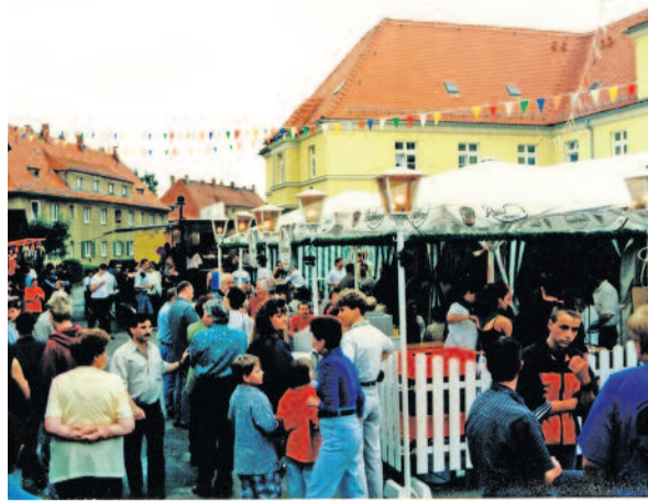
Das erste Kohlrabi-Inselfest fand kurz vor der Jahrtausendwende im Jahr 1999 statt.

Am Freitag, dem 30.06.23 und Samstag, dem 01.07.23 ist es wieder soweit! Pünktlich zum 25-jährigen Bestehen des Kohlrabi-Inselvereins Radeberg e.V. wollen wir nach (leider) 10-jähriger Pause mit neuen Kräften wieder ein Sommerfest auf der Kohlrabi-Insel veranstalten.