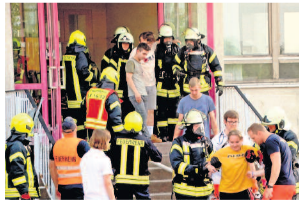
Verletzte werden geborgen. Bei der Einsatzübung wird der Ernstfall sehr realistisch nachgestellt.