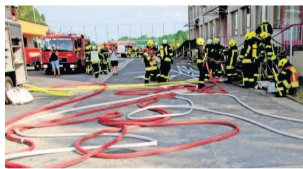
Großeinsatz der Feuerwehren: Die alte Plattenbauschule in Arnsdorf diente als Schauplatz einer Großübung der Feuerwehren.

Am Donnerstag vergangener Woche heulten um 17.37 Uhr die Sirenen in Arnsdorf und Umgebung. Was war passiert? In der alten Arnsdorfer Plattenschule war es bei Montage- und Wartungsarbeiten an der Gas- und Heizungsanlage zu einer Explosion mit Brandfolge gekommen. Die ersten Einsatzkräfte vor Ort bekamen die Information, dass drei Monteure im Keller vermisst werden und sich weitere 25 Personen mit unterschiedlichen Verletzungen noch im Schulgebäude aufhalten müssen. Keine leichte Aufgabe für die Kameraden bei Außentemperaturen von über 30 Grad Celsius.