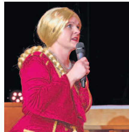
Wird Rapunzel fündig?

Programmatisch gibt es einmal mehr ein Thema, das alles verbindet. Es wird auf jeden Fall wieder märchenhaft. Rapunzel hat während der 58. Karnevals-saison in Langebrück leider nicht den perfekten Prinzen gefunden.