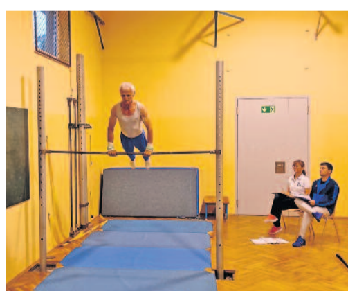
Geturnt wurde ein Mehrkampf als Kürwettkampf, auch das Stützreck gehörte dazu.

17. Altersklassen-Wettkampf im Gerätturnen der Männer in der Ortschaft durchgeführt / Insgesamt 14 aktive Turner am Start