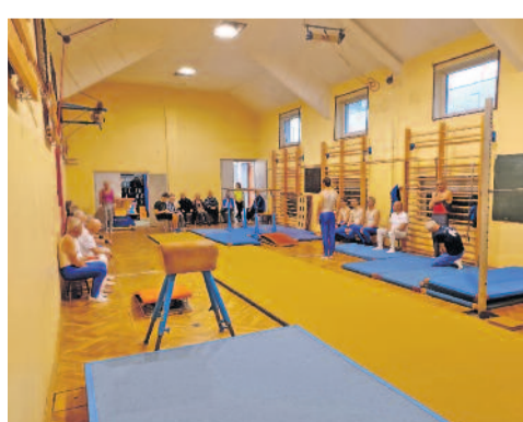
In seiner Vereinsturnhalle führte der Turnverein Langebrück den 17. Altersklassen-Wettkampf im Gerätturnen der Männer durch.