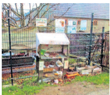
Bereits im Frühjahr wurde die Kasse geplündert und der Pflanztisch demoliert. Es sollte nicht bei einem Mal bleiben.