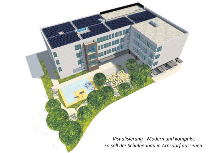
Visualisierung - Modern und kompakt: So soll der Schulneubau in Arnsdorf aussehen.