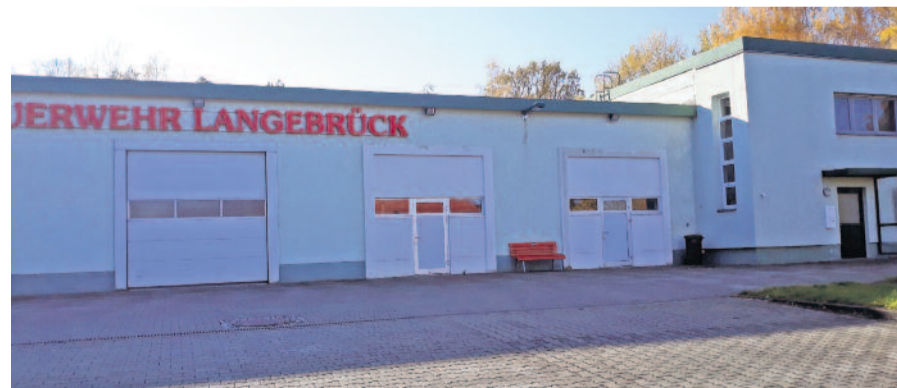
Das Langebrücker Feuerwehrhaus in der Lessingstraße 11 erfordert einen Neubau. Auf dem Areal ist bislang auch die Bauhof-Außenstelle zu finden.

tigen Beschluss. Zu finden ist die Außenstelle des Bauhofes künftig im Dörnichtweg 4. Das Objekt bietet ausreichend Platz für alle einzulagernden Gegenstände des Bauhofes und muss nur geringfügig ertüchtigt werden, heißt es dazu. Notwendig sind laut Kostenaufstellung eine Tragwerkplanung, Vermessung, Umsetzung des Carports Lessingstraße, Schließanlage, Zaunbau und Elektroarbeiten, die unterm Strich eine Gesamtinvestition in Höhe von 79.750 Euro ergeben. Die Kosten tragen das Brand- und Katastrophenschutzamt sowie die Ortschaft zu gleichen Teilen. Heißt, die Langebrücker investieren hier 40.000 Euro aus der Investpauuschale. Bereits am 6. Dezember 2022 fasste das Gremium einen Beschluss, dass 50.000 Euro dafür eingeplant werden. Dies wurde bislang zurückgestellt, bis die Thematik vollständig geklärt ist.