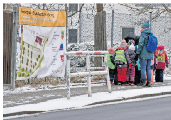
Auch wenn es von außen nicht so aussieht - die Halle erfreut sich reger Nutzung. So kommen unter anderem die Kinder der umliegenden Kitas, um hier zu toben und Sport zu machen.