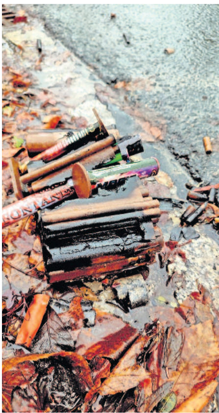
Ein unschöner Anblick - die Reste der Silvesternacht sind trotz intensiver Bemühen des Stadtwirtschaftshofes noch an einigen Stellen sichtbar.

Der Neujahrsspaziergang gehört für viele Bürgerinnen und Bürger am 01. Januar zur festen Tradition. Doch wer am ersten Tag des Jahres 2024 durch die Radeberger Straßen lief, dem fielen wohl vor allem die Hinterlassenschaften der Silvesternacht auf. Überall fanden sich Batterien, Knallkörper, Böller, Raketen und Verpackungsmüll. An dieser Stelle fragt man sich schon, warum dieser Müll nicht einfach durch den Verursacher beseitigt wird? Wer nun meint, dass ein jeder am Neujahrstag für Ordnung sorgt, wird auch hier enttäuscht. Auch am 02. Januar und bis heute findet man die Reste der Feierlichkeiten. Doch gehört es nicht zum guten Ton bzw. verlangt es der Anstand, seinen Müll auch wegzuräumen? Wir haben uns bei der Stadtverwaltung bzw. beim Stadtwirtschaftshof erkundigt und einige Fragen zu diesem Thema gestellt: