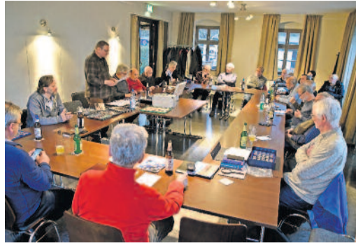
Auch im Jahr 2024 werden am Stammtisch der Langebrücker Münzsammler wieder viele interessante Themenabende stattfinden. Interessierte sind jederzeit herzlich willkommen.

Die Themenabende hierzu finden, wie bisher, im Café des Langebrücker Bürgerhauses statt und beginnen jeweils 18.30 Uhr. Die fachliche Ausgestaltung der Einzelthemen nach Schwerpunkten obliegt dem Vortragenden und erfolgt in Abstimmung mit den Münzfreunden.