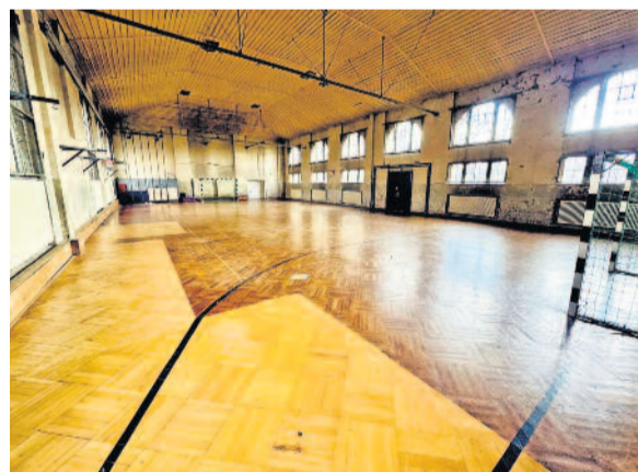
Wenn alles planmäßig verläuft, könnte die Sanierung der Halle im Innenbereich 2025 starten.