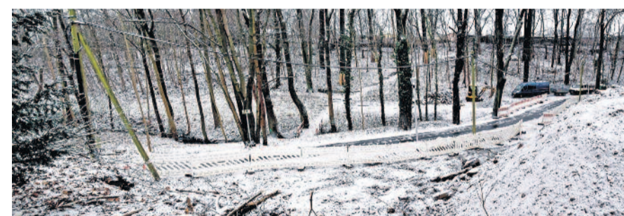
Gleich in unmittelbarer Nähe der Turnhalle erfolgen ebenfalls Sanierungsarbeiten. Das „Birkenwäldchen“ erfährt eine Aufwertung und wird im Rahmen des Grünen Bandes zum Aktivpark umgestaltet.

Die vom Stadtrat gewählte Variante 2 zur Sanierung der Turnhalle beinhaltet die Umnutzung bzw. Verbesserung und Erweiterung der vorhandenen sanitären Anlagen, die Erneuerung des Hallenfußbodens als Sportboden für verschiedene Nutzungen, die Herstellung eines umlaufenden Prallschutzes, die mehrseitige Vorbereitung für größere Veranstaltungen sowie den Flächenvorhalt für Belegungen im Katastrophenfall. Ausgelegt sein wird die Halle dann für eine Kapazität von über 200 Personen. Die Personenanzahl spielt vor allem bei den Planungen zum Brandschutz sowie der Herstellung von Flucht- und Rettungswegen eine große Rolle. Es tut sich also einiges auf diesem Abschnitt der Pulsnitzer Straße. Immerhin entsteht gerade auch der lang ersehnte, öffentliche Parkplatz im rückwärtigen Bereich der Turnhalle. Auch dafür gab es Fördermittel. Weitere Fördergelder generiert die Stadt im Rahmen des Projektes „Grünes Band“. Einiges ist im Grünen Band bereits entstanden. Momentan wird die Einzelmaßnahme „Gestaltung Aktivpark Hofgrund“ umgesetzt. Der bei den Radebergern als „Birkenwäldchen“ bekannte Park wurde bereits 1994 revitalisiert. Leider überdauerte diese Gestaltung nicht sehr lange und das Birkenwäldchen bekam kaum noch Beachtung. Wege verschwanden, der Park verwilderte - nun entsteht auf rund 12.300 m 2 eine Aktiv-/ Bewegungs- und Naturfläche mit Anbindung an die angrenzenden Grünflächen und Radwege.