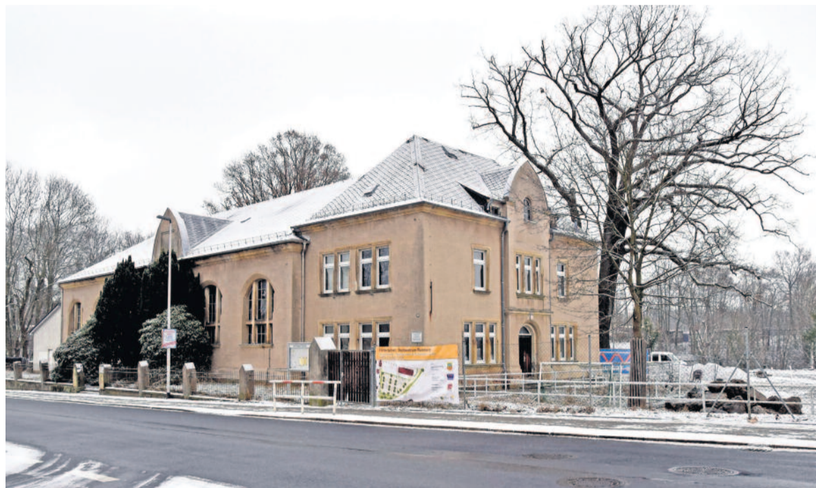
Fast 125 Jahre prägt die Turnhalle das Stadtbild an der Pulsnitzer Straße. Nun bekommt die Stadt Fördermittel zur Sanierung des alten Gebäudes.

„Wir konnten ein weiteres wirklich wichtiges und gutes Projekt auf den Weg bringen“, erklärt Oberbürgermeister Frank Höhme dazu. „Nach einer intensiven Diskussion beschloss der Stadtrat, diese für den Vereins-, Breiten- und Schulsport sowie zur Nutzung für kleinere Veranstaltungen zu ertüchtigen. Aber auch die Thematik Notfallbelegung im Katastrophenfall wird in den weiteren Planungen berücksichtigt. Trotz des aktuellen Zustandes erfreut sich die Turnhalle einer hohen Nachfrage, welcher wir mit unserem Vorhaben dann auch langfristig nachkommen können. Egal, ob für Vereine, unsere Kitas, das Epilepsie-Zentrum, den Schulsport oder auch für Kleinausstellungen, Märkte und sonstige Veranstaltungen, die Nutzungsmöglichkeiten sollen flexibel und vielseitig sein. Daran werden wir nun intensiv weiterarbeiten“, ergänzt das Stadtoberhaupt.