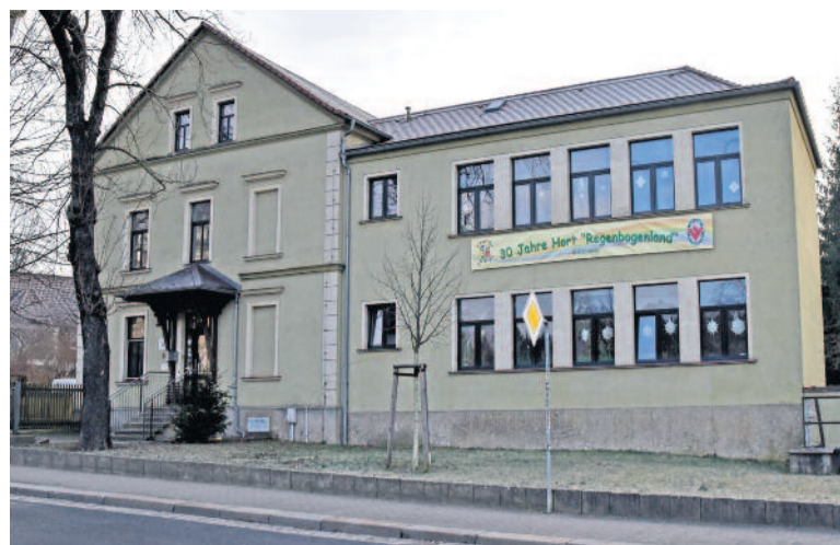
Vom 22.01. - 26.01.2024 findet im Hort Regenbogenland eine Festwoche im Rahmen des 30-jährigen Jubiläums statt.

Seit 3 Jahrzehnten können Kinder der Grundschule Stadtmitte Radeberg nun schon ihren Nachmittag im Hort Regenbogenland unter der Trägerschaft der Volkssolidarität Elbtal-Kreis Meißen e. V. verbringen. Gemeinsam mit ihren Erzieherinnen und Erziehern erleben sie einen bunten, abwechslungsreichen Nachmittag und können den Schultag ausklingen lassen.