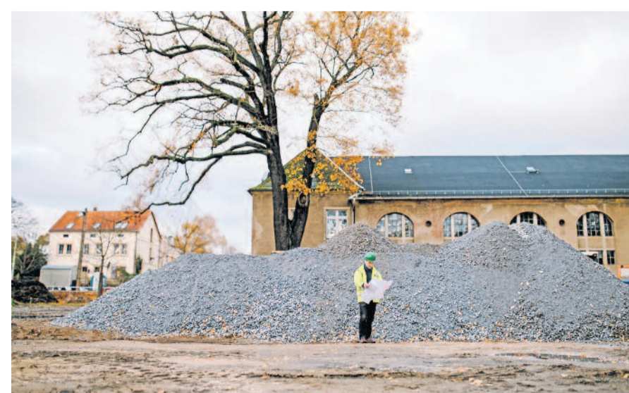
Bauarbeiten an der Pulsnitzer Straße: Die Arbeiten zum Bau des öffentlichen Parkplatzes gehen gut voran.

Notfallservice der Tagesklinik für Kleintiere Stolpen Tel. 035973 2830 wochentags: 8.00 Uhr - 21.00 Uhr samstags: 8.00 Uhr - 17.00 Uhr (mit telefon. Anmeldung)