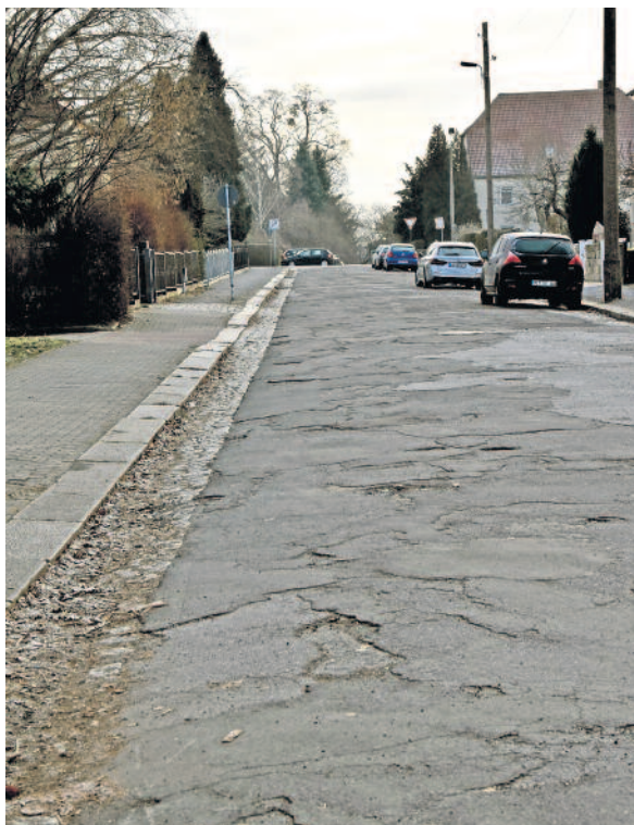
Die für den Durchgangsverkehr größte Einschränkung wird die Vollsperrung der Schillerstraße am Kreuzungsbereich Goethestraße sein. Diese ist derzeit für den Zeitraum 20.03. bis 12.04.2024 geplant. Der Linienbusverkehr wird in dieser Zeit umgeleitet. Bitte beachten Sie die Aushänge an den Haltestellen bzw. die Fahrplanänderungen unter www.vvo-online.de/de/fahrplan/fahrplanaenderungen .

tüchtigung des Mischwasserkanals von 499.200 Euro aufzunehmen. Grund ist, dass der Eigenbetrieb aktuell geplante Investitionen nur durch Fremdfinanzierung umsetzen kann. Dieses Vorgehen ist durch die Rechtsaufsichtsbehörde genehmigt.