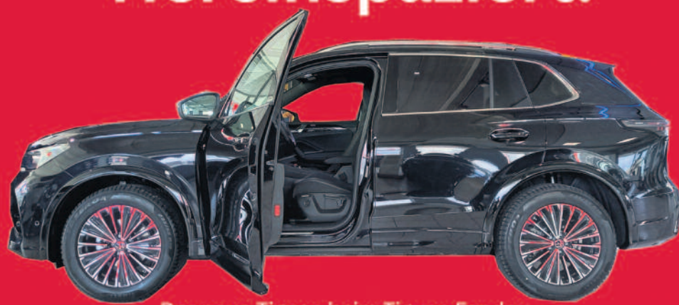
Der neue Tiguan beim Tiguan Fanday