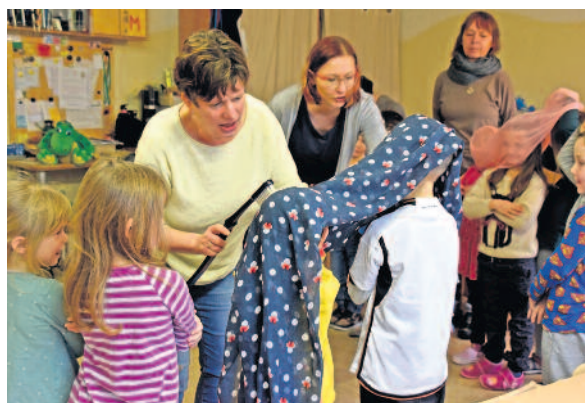
Jedes Kind steht so fest wie ein Zahn im Gebiss. Jetzt wird der Schmutz weg geputzt.

in den Kita-Alltag ein, sodass wir uns wieder auf wunderbare, spannende Vorschulabenteuer konzentrieren können. Vielen Dank, dass ihr mich zu Beginn des Monats Februar zu euch in den Kindergarten eingeladen habt.