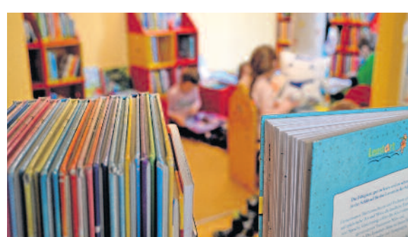
Am meisten entliehen werden Kinder- und Jugendbücher, die 32,4 Prozent der gesamten entliehenen Medien ausmachen.

Einen neuen Platz hat auch die Regionalliteratur, die vorher hinter der Ausleihtheke zu finden war, bekommen. Das sorgt vor allem dafür, dass die Bücher über Radeberg und die Region besser wahrgenommen werden.