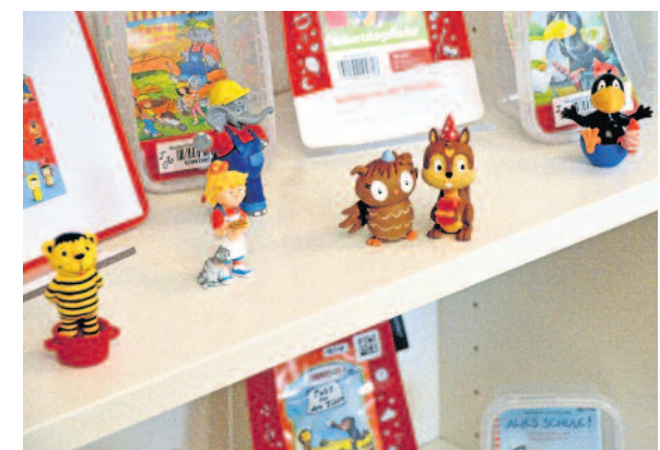
Die beliebten Hörspiel-Figuren der Tonie-Box sind sehr gefragt und wurden im vergangenen Jahr über 2.000 Mal ausgeliehen.