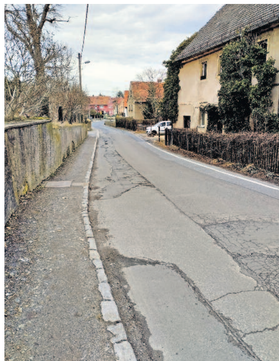
Weiterhin ist Geduld gefragt, bis der Straßenabschnitt in der Hauptstraße im Langebrücker Unterdorf saniert wird.

Ferienzeit ist bekanntlich Bauzeit und wird sehr gern für Straßenbauarbeiten genutzt. In der Ortschaft Langebrück ist ein Tausch der Deckschicht auf der Hauptstraße vorgesehen. Dies betrifft den Abschnitt zwischen den Hausnummern 22 und 34. Seitens der Verwaltungsstelle Weixdorf/Langebrück wurde angefragt, ob es nicht außerhalb der Ferien möglich sei. Wie es in der Mitteilung heißt, lehnte die zuständige Sperrkoordinierung beziehungsweise die Straßenverkehrsbehörde die Bitte ab. Konkret wurde vorgeschlagen, ob die Umleitung während der Bauzeit über die Lessingstraße/Klotzcher Straße erfolgen kann und somit zu einem anderen Zeitpunkt realisiert werden könnte.