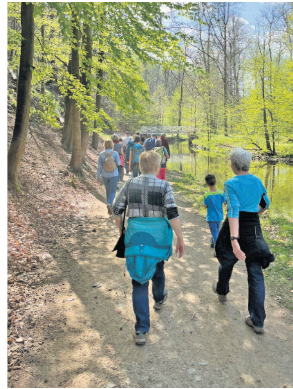
Vier Stunden waren sie unterwegs.