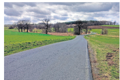
Zwischen Seifersdorf und Lomnitz werden die Straßenränder instandgesetzt. Lediglich der Bus darf die Strecke während der Bauzeit nutzen.

Die mittlere Fahrbandbreite beträgt etwa 4,75 m und es ist kein Verkehr über 7,5 t zugelassen. Die Buslinie 760 zwischen Radeberg und Medingen fährt zweimal stündlich. Aufgrund der geringen Fahrbandbreite ist ein Ausweichen des Verkehrs auf die Randstreifen unvermeidbar. Dabei sind Niveauunterschiede von bis zu 10 cm festzustellen, insbesondere in den Kurveninnenseiten.