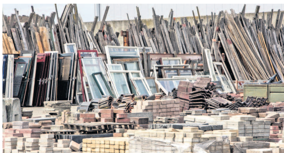
Viele Baustoffe können recycelt und wiederverwendet werden. Das trägt zum Klima- und Umweltschutz bei.

tn. Bei der Modernisierung von Gebäuden rückt das Thema Nachhaltigkeit immer stärker in den Fokus. Ein wesentlicher Aspekt dabei ist die Verwendung von recycelten Baustoffen. Diese Praxis trägt nicht nur zum Umweltschutz bei, indem sie den Bedarf an neuen Rohstoffen reduziert, sondern kann auch Kosten senken und den ökologischen Fußabdruck eines Bauvorhabens minimieren. Hier ein Blick auf einige Baustoffe, die recycelt werden können und wie sie bei der Modernisierung von Gebäuden zum Einsatz kommen.