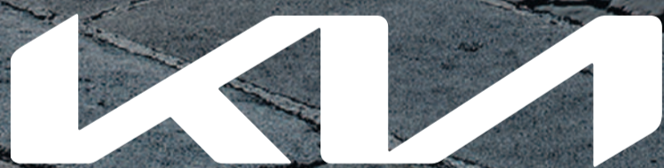
Abbildung zeigt kostenpflichtige Sonderausstattung.

Jeder Moment schafft neue Möglichkeiten. Und um diese ideal zu nutzen, bedarf es maximaler Flexibilität. Genau diese findest du im Kia Picanto. Denn trotz seiner kompakten Maße bietet er eine überraschende Geräumigkeit, ein Höchstmaß an Komfort sowie einen großen, variablen Kofferraum. Lass dich vom Kia Picanto bei einer Probefahrt bewegen.