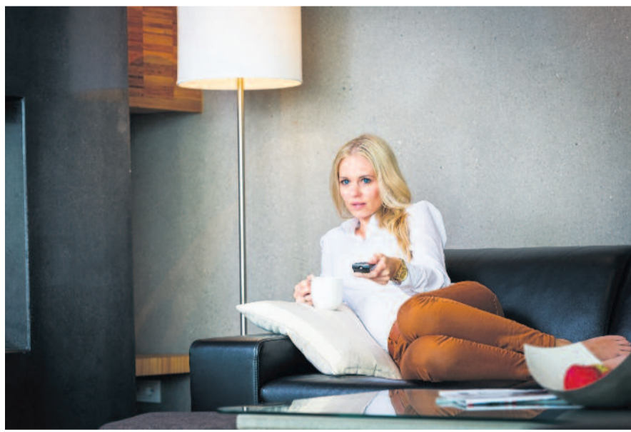
txn. Um sich Zuhause richtig wohlfühlen zu können, ist ein gutes Raumklima wichtig. Wände und Decken aus Beton helfen dabei - denn sie puffern Temperaturspitzen im Sommer und im Winter ab.

txn. Das Raumklima trägt sehr deutlich zum Wohlbefinden im Eigenheim bei. Zugige Kälte im Winter und brütende Hitze im Sommer sind meist Zeichen unzureichender Wärmedämmung. Auch wenn die Außenmauern keine Temperaturen abpuffern können, leidet der Wohnkomfort. Baufamilien sind daher gut beraten, schon bei der Planung des Eigenheims den bauli-