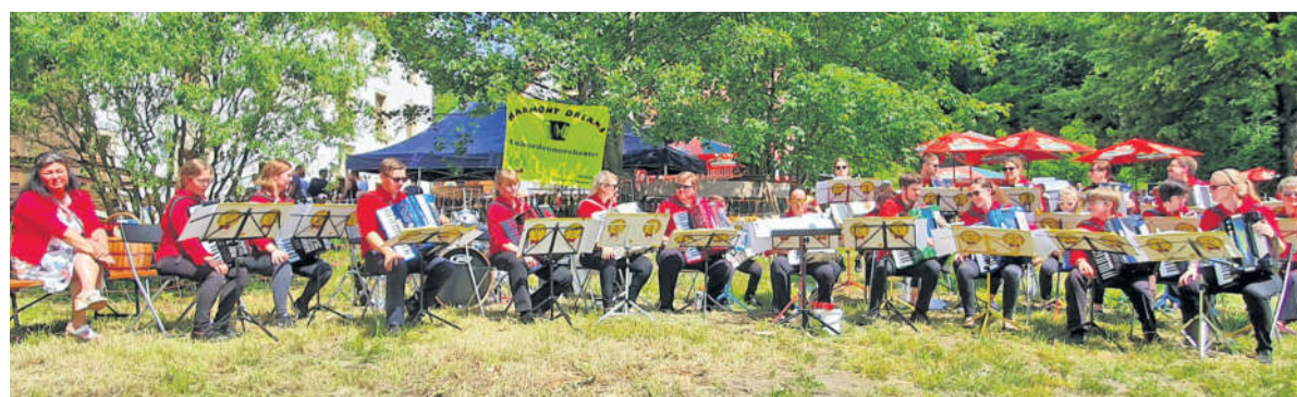
Das Akkordeon-Orchester „Harmony Dreams“ gestaltete das Konzert mit.

Unterm Strich ein rundum gelungenes Pfingstkonzert. Am Ende formulierten Veranstalter, Akteure und Zuhörer einen gemeinsamen Wunsch, dass das Pfingstfest 2023 wieder wie gewohnt auf der Tanzwiese stattfinden sollte.