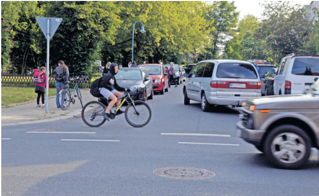
Unübersichtliche Verkehrssituation am Abzweig Heidestraße / Schönfelder Straße.

In einer von Elternvertretern und Schulleitung erarbeiteten Übersicht zu notwendigen Maßnahmen steht die Schönfelder