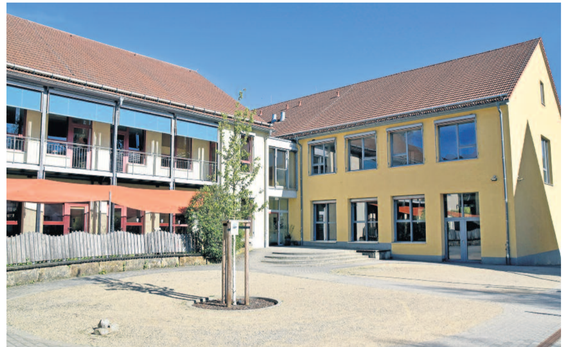
Die frei gewordenen Räume in der Liegauer Kita sollen nun umgebaut werden und der Grundschule als Außenstelle dienen.

Die veranschlagten 400.000 Euro sorgten im Stadtrat für Nachfragen. Daniel Looke (AfD) wollte wissen, wie sich die Summe zusammensetzt und ob Fördermittel bereits berücksichtigt seien. Er halte die Kosten „für 2 Räume“ für „sehr viel Geld“.