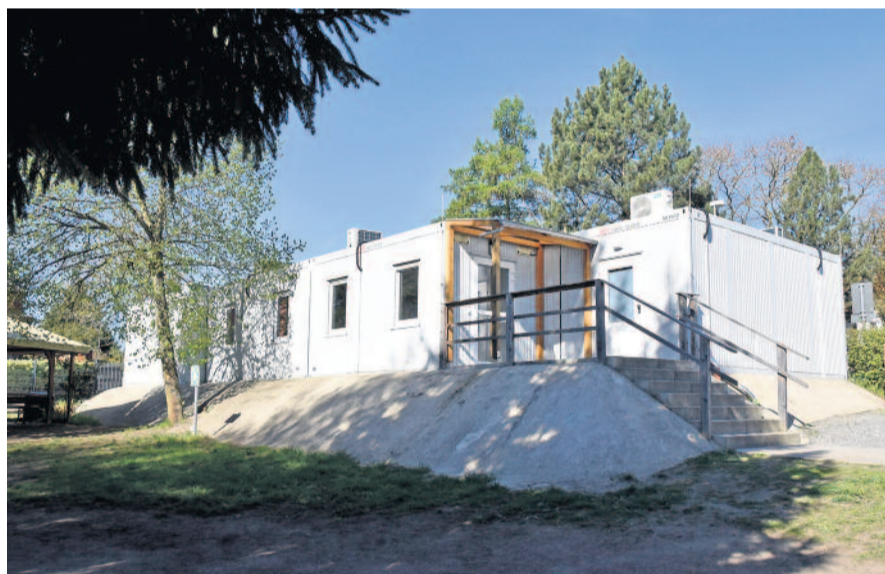
Seit 2022 stehen die Schulcontainer oberhalb der Grundschule. Eine weitere Verlängerung der Baugenehmigung wurde von der Bauaufsicht bereits ausgeschlossen.

Oberbürgermeister Frank Höhme erklärte, dass Fördermittel bislang nur für eine geplante Photovoltaikanlage vorgesehen seien. Diese werde mit rund 100.000 Euro kalkuliert und könne bis zu 90 Prozent gefördert werden. Wenn diese Förderung bewilligt wird, würde das die Gesamtkosten für die Stadtkasse senken. Sollte die Förderung ausbleiben, könne man den Bau der Anlage „noch einmal überdenken und ggf. streichen“. Als wesentliche Kostentreiber nannte er insbesondere Planung und Bauantrag. Auch Dirk Hantschmann (Wir für Radeberg) äußerte sich zu den Kosten der Photovoltaikanlage und schlug eine separate transparentere Aufschlüsselung im Beschluss vor – fand dafür jedoch keine Mehrheit. Robert Mieth (CDU)