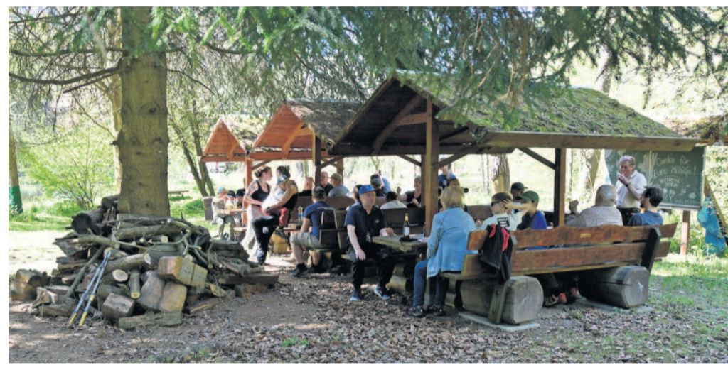
Stärkung nach getaner Arbeit: Insgesamt wurden rund 90 Helferinnen und Helfer gezählt.