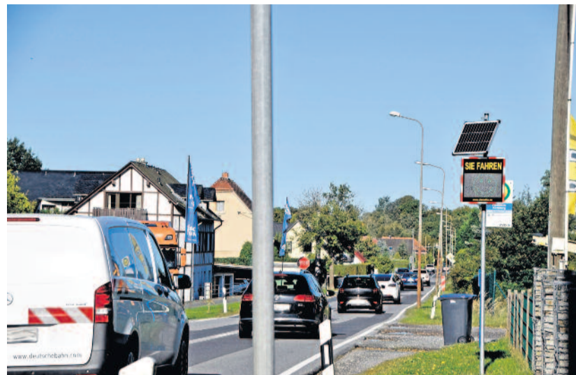
Schlecht ausgebaut, keine Geh- und Radwege: die Ortsdurchfahrt Fischbach weist etliche Gefahren auf und soll grundhaft saniert und ausgebaut werden.

Für das dritte Quartal 2026 ist die Beteiligung der sogenannten Träger öffentlicher Belange vorgesehen, darunter Leitungsträger, das Landratsamt, die Gemeinde und die Polizei. Wenn alle Abläufe ohne Verzögerungen verlaufen, könnte Ende 2026 Baurecht vorliegen. Anschließend würden – abhängig von den verfügbaren Haushaltsmitteln – die Ausführungsplanung und die Vorbereitung der Ausschreibungen in den Jahren 2027 und 2028 folgen. Ein