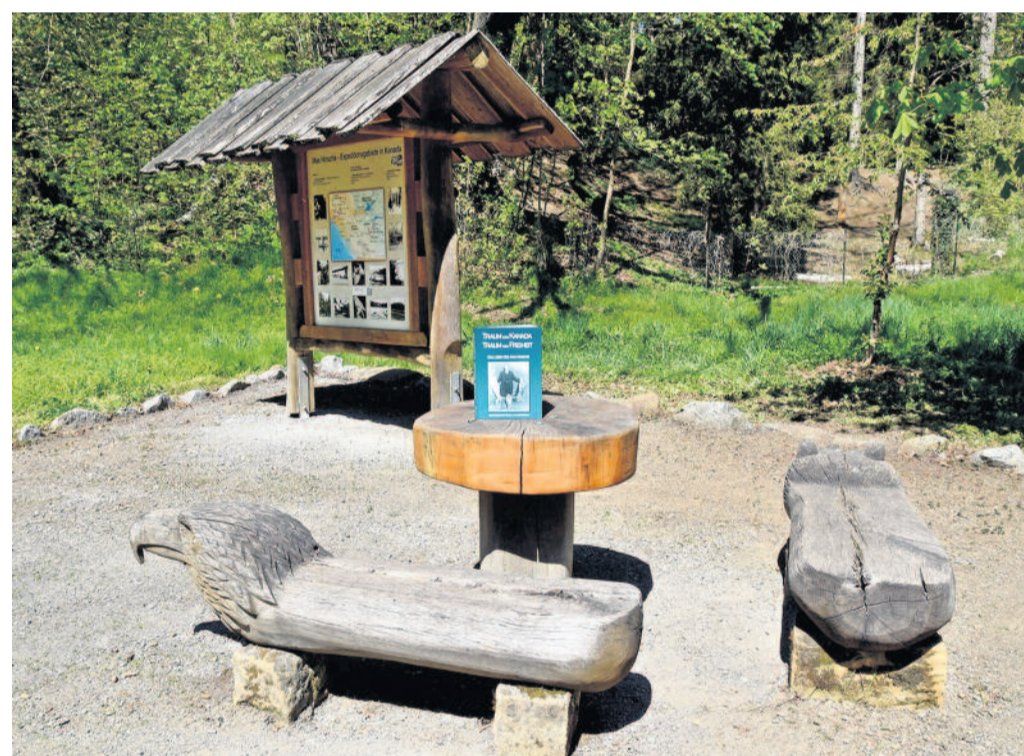
Einsatz in der Sonne: Pünktlich zu einem kleinen Jubiläum strahlt auch das Ehrenmal für den Radeberger Naturforscher Max Hinsche wieder. Ende Mai 1926, also vor 100 Jahren, begann seine spannende und herausfordernde Expedition nach Kanada.