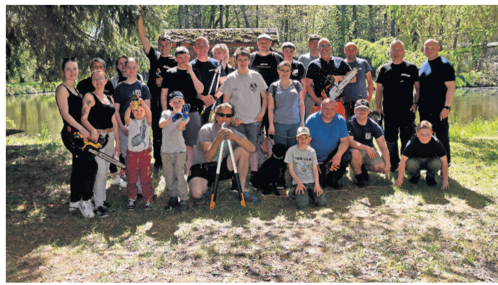
Starke Unterstützung kam diesmal aus Wallroda. Danke an die Freiwillige Feuerwehr und deren Nachwuchs.

Am 02. Mai 2026 haben wir als Förderverein Hüttertal Radeberg e. V. erneut zur traditionellen Aktion „Sauberes Hüttertal“ ins Hüttertal eingeladen – und wurden mit einer Rekordbeteiligung belohnt. Rund 90 engagierte Helferinnen und Helfer folgten unserem Aufruf und unterstützten uns bei bestem Wetter dabei, unser schönes Naherholungsgebiet fit für die warme Jahreszeit zu machen. Gemeinsam wurde tatkräftig angepackt: Wege wurden freigeschnitten, Laub vom vergangenen Jahr zusammengekehrt und das Max-Hinsche-Ehrenmal gründlich gereinigt sowie von Unkraut befreit. Auch größere Aufgaben konnten bewältigt werden – so wurde unter anderem ein Schild an der Hüttertalbaude samt Fundament ausgehoben.