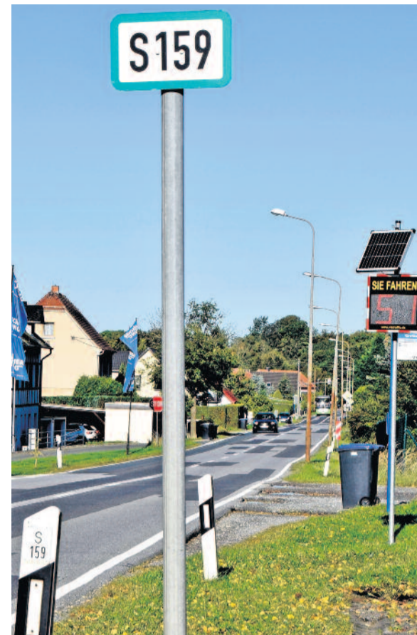
Das Verfahren um den Ausbau der S 159 in der Ortslage Fischbach befindet sich derzeit in der Genehmigungsplanung. Ein Baustart liegt noch in weiter Ferne.

Der Beschluss für das Bauvorhaben wurde bereits im August 2025 im