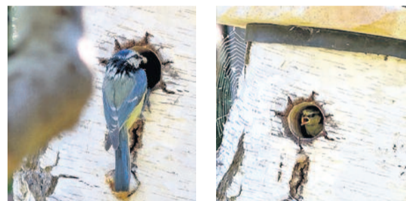
Text & Fotos: Fam. Hanso

Liebes Team der Radeberger Heimatzeitung, wir, Familie Hanso aus Radeberg, senden Ihnen was ganz besonderes. Das 1. Mal, dass wir es so hautnah erleben durften, wie die kleinen Blaumeisen ins Leben starten. Einfach nur schön. Wir möchten diesen schönen Moment mit den Lesern teilen, denn die kleine Blaumeise ist sehr scheu. Umso mehr erfreut es uns, dies in unserem Garten beobachtet zu haben.