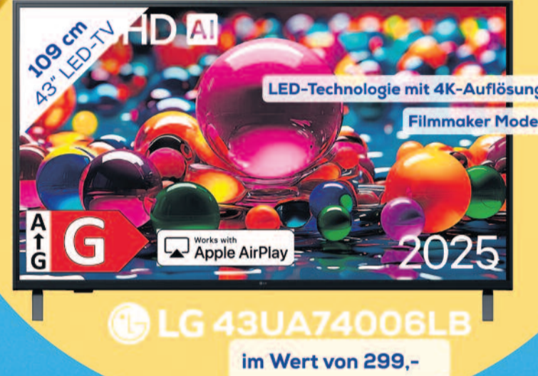
LG 43UA74006LB im Wert von 299,-