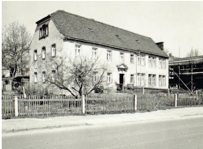
Zweites Schulgebäude von 1838 mit Anbau von 1884

1838. Im Erdgeschoss des Gebäudes befand sich ein Klassenzimmer und das Obergeschoss wurde vom Kantor der Kirchengemeinde als Wohnung genutzt. Der Zeitpunkt des Neubaus war günstig, da das alte Schulgebäude zwei Jahre später niederbrannte.