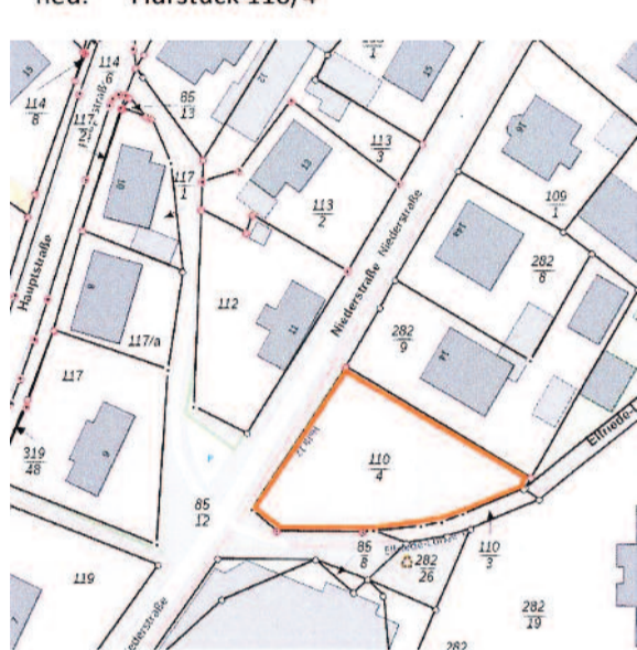
Karte 01 - Öffentlicher Weg Nr. 17 „ÖW“ Flurstück 85/6 (jetzt Teil des Flurstückes 110/4) der Gemarkung Arnsdorf in 01477 Arnsdorf (Bestandsverzeichnis für beschränkt-öffentliche Wege und Plätze) Einziehung gemäß Gemeinderatsbeschluss Nr. 65/12/2025 am 27.08.2025

Die Gemeindeverwaltung Arnsdorf hat am 09.06.2026 die Einziehung der genannten Straße, Bestandsverzeichnis für beschränkt-öffentliche Wege und Plätze Nr. 17 „ÖW“ im Ortsteil Arnsdorf, verfügt.