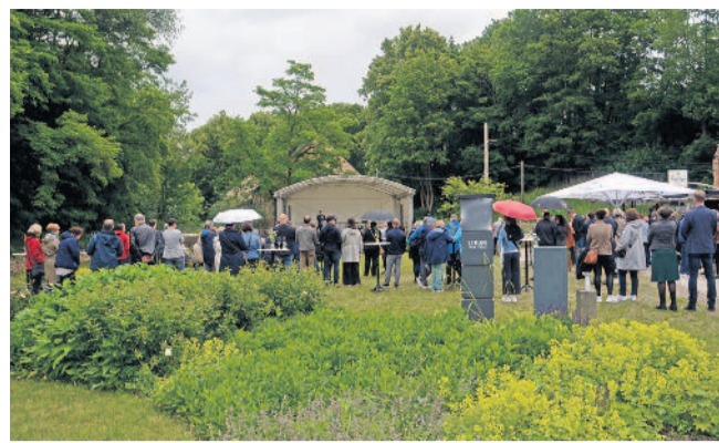
Zahlreiche Gäste kamen trotz des unbeständigen Wetters in den Schlossgarten von Schloss Klippenstein.