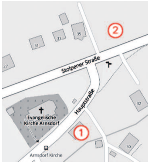
Ehemaliger Standort des ersten und zweiten Schulgebäudes

Die nächste Erweiterung des Schulgeländes erfolgte im Jahr 1922. Der Arnsdorfer Turnverein baute auf dem Schulgelände eine Turnhalle und einen Sportplatz. Besonders die Umstände der Entstehung machen diese erste Arnsdorfer Turnhalle aus sozialhistorischer Sicht sehr bedeutsam. Die ursprünglich zugesagte Bürgerschaft der Gemeinde für die Finanzierung der benötigten Baustoffe wurde, wegen der schwierigen