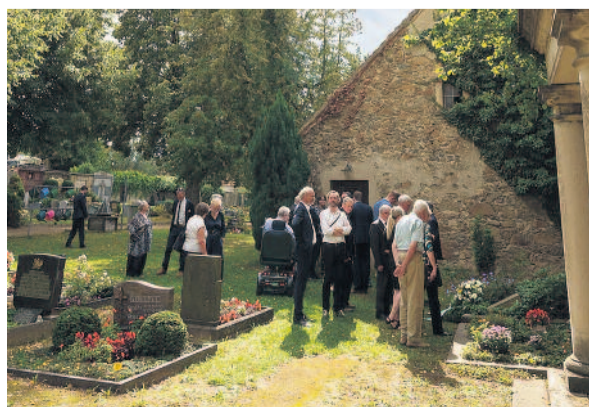
An diesem Standort befindet sich die Grabstätte von Familie Hickmann.