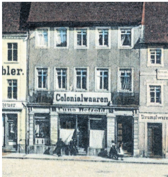
Abbildung von 1901

Markt 9 (ab 1905, zuvor Am Markt 9), entspricht der Katasternummer 50