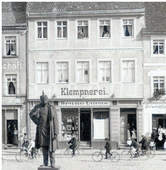
Abbildung um 1910

Quelle: Radeberger Blätter, Heft 8/2010, Bert-ram Greve: „Die Radeberger Mitte - der Markt“, S. 8ff, Heft 13/2015 Bernd Rieprich: „Die Flitterfabrik Unger“, S. 27ff, Aufzeichnungen Rudolf Limpachs, Archiv Schloss Klippenstein