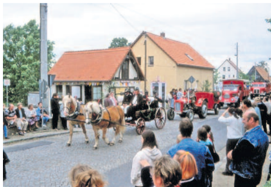
Zum Abschluss der Feierlichkeiten des 100-jährigen Feuerwehrjubiläums am 28.05.2000 fand dann der große Festumzug durch den Ort mit über 90 Bildern statt.

Die Jugendfeuerwehr Großerkmannsdorf beging am 18.09.2000 ihr 10-jähriges Bestehen. Dafür gab es eine kleine Feier am Gerätehaus und eine Übung mit den Nachbarjugendfeuerwehren.