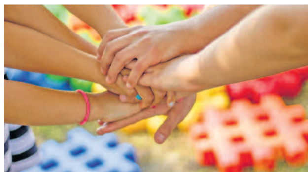
Mit der Kinder- und Jugendinitiative Radeberg hat sich eine Gemeinschaft gefunden, die für ihre Mitmenschen und das Stadtbild aktiv sein wollen. Treffpunkt der Gruppe ist im MGZ Radeberg.

aktiv mitbestimmen dürfen und sich auch gehört und vertreten fühlen? Eine Möglichkeit bietet seit Oktober dieses Jahres die Kinder- und Jugendinitiative im Mehrgenerationenzentrum Radeberg. Hier haben sich junge Menschen zusammengefunden, die zuvor im Kinder- und Jugendstadtrat mitwirkten. Die Initiative ruft alle interessierten Kinder und Jugendlichen auf, die Lust haben, sich um