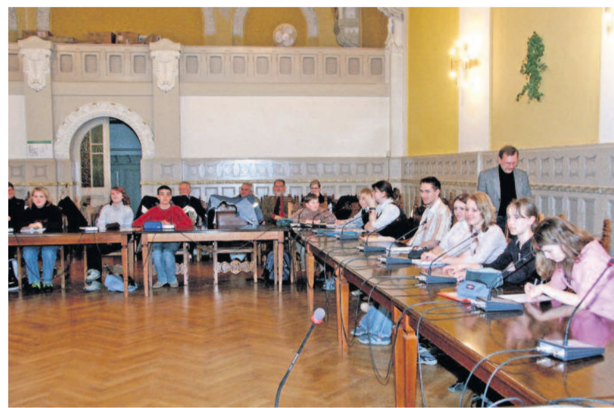
2005 wurde der Kinder- und Jugendstadtrat Radeberg ins Leben gerufen. Seit 20 Jahren sitzen Schülervertreterinnen und -vertreter zusammen. Mit neuen Fördermöglichkeiten soll es damit auch die nächsten Jahre weitergehen.

Wie können wir Plattformen schaffen, um die nächsten Generationen an der Gestaltung ihres Heimatortes teilhaben zu lassen? Welche Wege gibt es, damit Kinder und Jugendliche