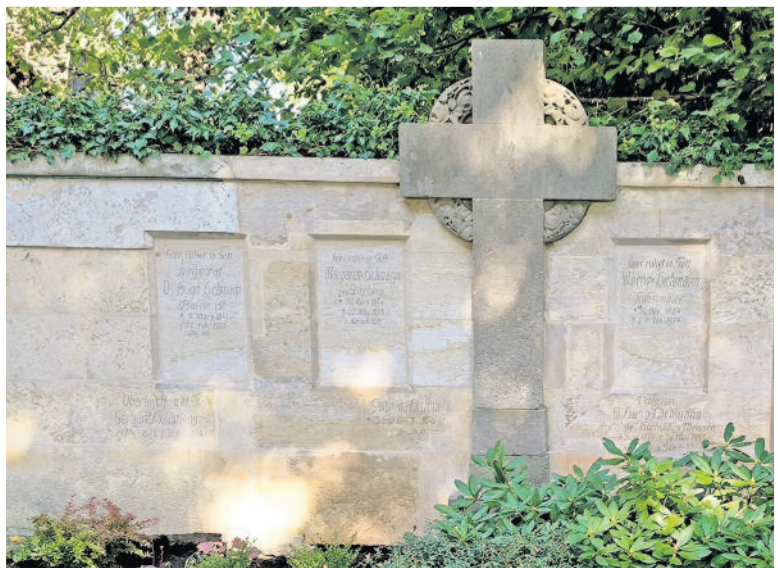
Die sanierte Grabstätte von Familie Hickmann auf dem Langebrücker Friedhof.