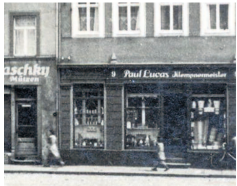
Abbildung um 1935