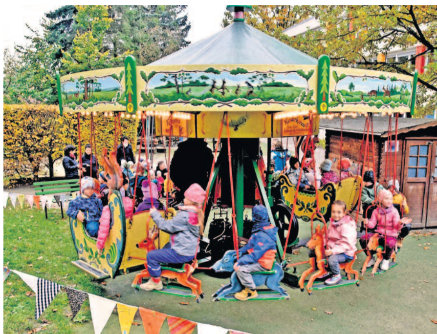
Das Team vom Radeberger Kinderland