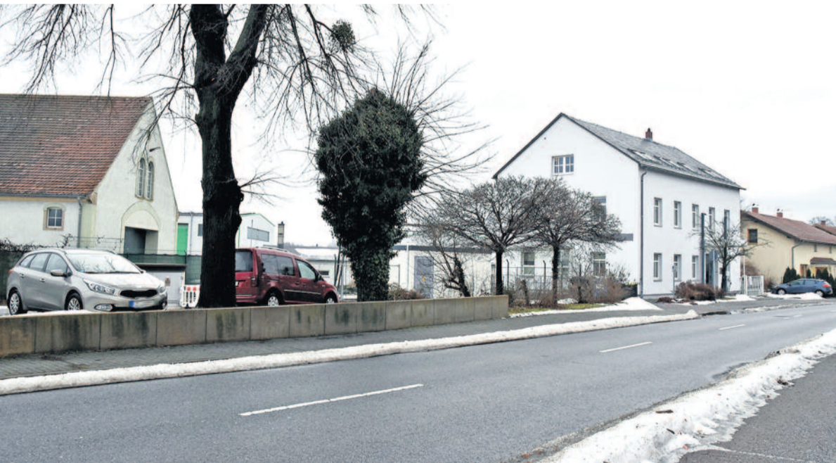
Der belastete Altstandort des Glashüttenwerkes soll künftig Domizil eines großen Radeberger Medizin-Unternehmens werden. Für die Bodensanierung gab es nun Fördergelder vom Freistaat Sachsen.

Der Freistaat Sachsen unterstützt die Sanierung eines belasteten Altstandorts in Radeberg mit rund 6,6 Millionen Euro. Die Förderung übergab Umweltminister Georg-Ludwig von Breitenbuch gemeinsam mit der Landesdirektion Sachsen an die Firma ABX advanced biochemical compounds GmbH.