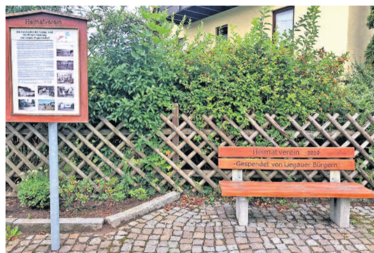
Am Siedlerbrunnen, Friedrich-Engels-Straße