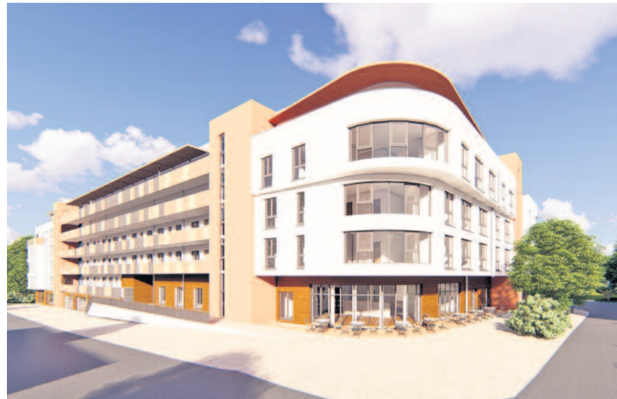
So soll der künftige Wohnpark aussehen: Ansicht Ecke Pulsnitzer Straße / An den Leithen. 139 Wohnungen und 5 Gewerbeeinheiten sind hier geplant.