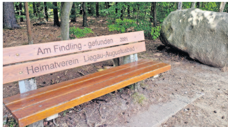
Am Findling, An den Folgen

"Vom Eise befreit sind Strom und Bäche, durch des Frühlings holden, belebenden Blick, im Tale grünet Hoffnungs-Glück; der alte Winter, in seiner Schwäche, zog sich in rauhe Berge zurück ..." (Johann Wolfgang von Goethe)