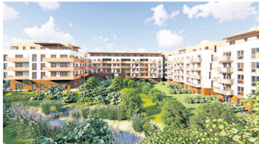
Der neue Wohnpark birgt im „Inneren“ eine schöne Grünanlage.