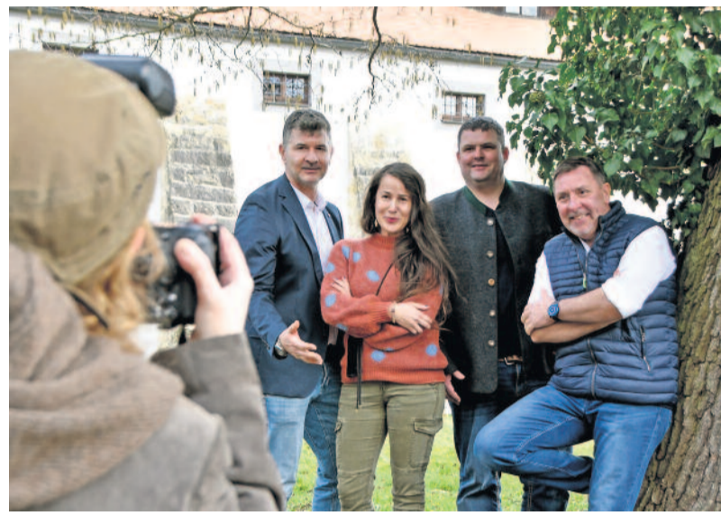
Schon zur Vorstellung des 1. Radeberger Sommertheaters war die Motivation um dieses neue Veranstaltungsformat zu spüren.